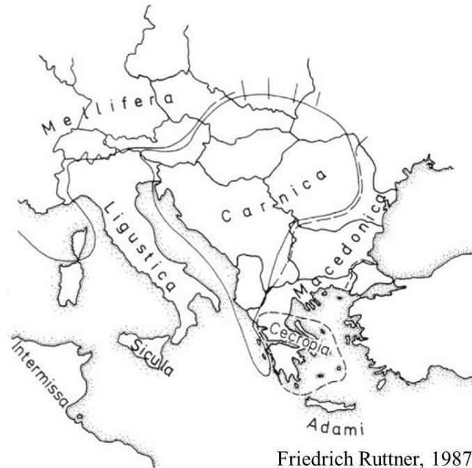
Friedrich Ruttner, 1987

A. m. mellifera , detta anche ape nera o ape tedesca , era presente in Italia sulle Alpi, lungo i confini con Francia e Svizzera e quindi in una stretta fascia di Liguria, Piemonte, Lombardia e Trentino Alto Adige, prevalentemente in forma ibridata con la ligustica. Di queste popolazioni alpine dell'ape nera è rimasto ormai poco, ma prima in Francia, e recentemente anche in Italia, sta crescendo tra gli apicoltori e le istituzioni la consapevolezza dell'importanza di salvaguardare queste popolazioni.