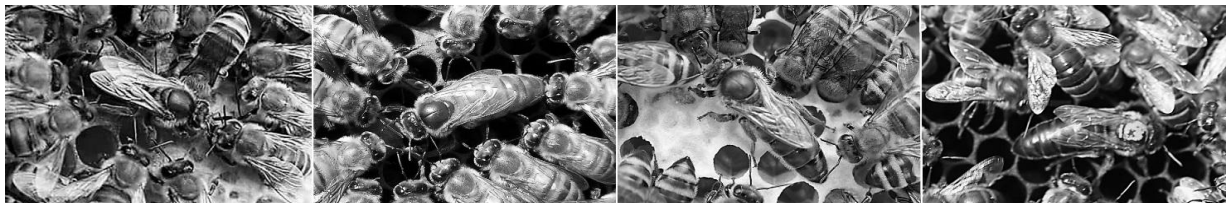
Api regine e alcune operaie di A. m. mellifera , A. m. ligustica , A. m. carnica e A. m. siciliana , le quattro sottospecie presenti in Italia ( mellifera e carnica solo con popolazioni ibridate in vario grado con ligustica )

In Italia, caso unico in Europa, sono naturalmente presenti popolazioni ascrivibili a ben 4 sottospecie: A. m. ligustica , A. m. siciliana (endemiche italiane), A. m. mellifera e A. m. carnica (queste ultime due probabilmente solo come popolazioni ibridate in vario grado con A. m. ligustica ).